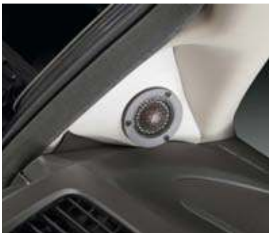
«Датская горошина», установленная в оконных «микропроёмах», работает с плоскости, в наилучших условиях

С пищалками штатный вариант не проходил — «родные» места располагались слишком далеко, под лобовым стеклом, да ещё и в углах. Образовавшийся рупор мог здорово испортить звучание на средних частотах (что успешно и сделал, когда всё-таки попробовали). Поэтому пищалки пришлось не только заменить, но и перенести подальше от стекла, поближе к ушам. Для них изготовили подиумы, которыми закрыли изнутри небольшие треугольные стёклышки по бокам лобового стекла — такое решение в Accent-Audio уже опробовано. Окошки эти в современных машинах не редкость, столь же нередко ими жертвуют в обмен на козырное место для ВЧ-излучателя, который начинает работать «с плоскости», практически в идеальных с точки зрения дифракционных искажений условиях. Окончательный ответ здесь всегда за владельцем машины: нужны ему эти амбразуры — ищем альтернативное решение, не нужны — выбираем оптимальное. В данном случае система приоритетов заказчика... впрочем, вы уже