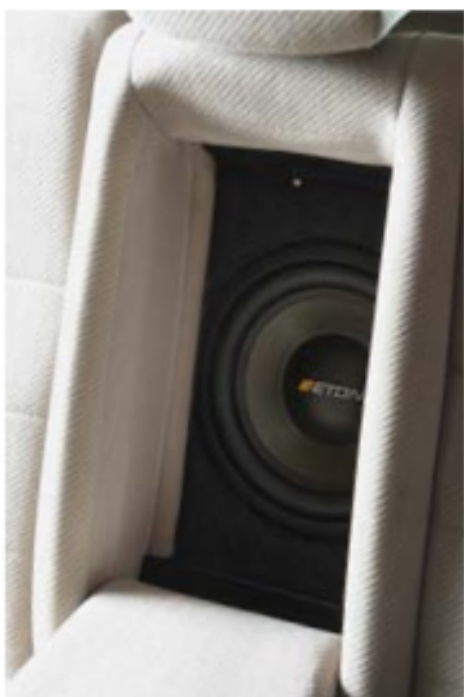
При откинутом подлокотнике сабвуфер вещает в салон прямым излучением, как заказывали

маленьким — 18 л, чего для Eton 10-630 HEX более чем достаточно. Я сказал «более чем», потому что тест этого сабвуфера в «АЗ» тоже нашёл и тоже изучил. Там говорится, что в таком объёме (рекомендованном изготовителем) немалая часть энергии уйдёт в инфранизкие частоты, если этого не требуется, можно объём брать вдвое меньше. Насколько это будет соответствовать наблюдениям в данной машине, мы увидим при измерениях, а пока (ознакомившись с тестом в №10/2011) могу лишь приветствовать выбор сабвуфера, достойного особы королевской крови.