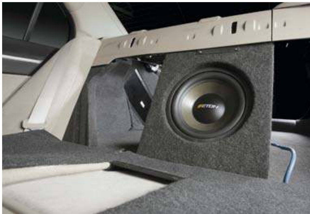
Корпус сабвуфера сделан мощным по кругу, а передняя панель — трижды мощной