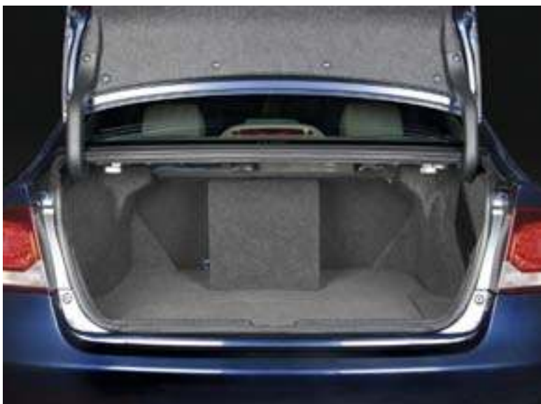
Сабвуфер-тумбочка — плод техзадания, справа и слева от него можно по-прежнему возить длину

видите на фотографиях, какая у него система приоритетов.