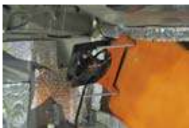
Установленный на краю монтажной панели вентилятор дует сразу на всю стопку компонентов

АРХИТЕКТУРА СИСТЕМЫ, ПУСТЬ И НЕ МОНУМЕНТАЛЬНЫХ ПРОПОРЦИЙ, САМАЯ ПРОГРЕССИВНАЯ